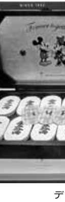
デイズニーク両箱