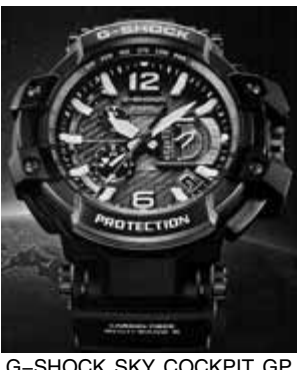
G-SHOCK SKY COCKPIT GP W-1000

究極の強度と絶対の精度、両者のあくなき追求が、活動領域を全世界に広げるGPSハイブリッド電波ソーラに結実