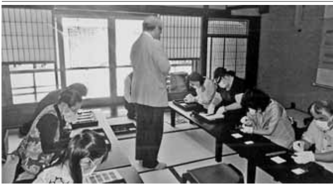
今回は喫煙具を中心とした内容だった

ソット、ピエロ・ミラノ、マルマ、チヨ里花、ウオルサム、フル、ポル、ゲルバーと豊富な品揃え