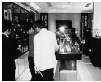
オープンした店内