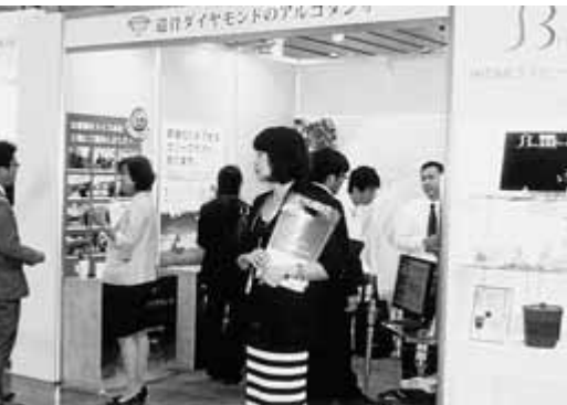
アルゴダンザ・ジャパンのブース