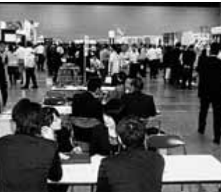
大勢の関係者が来場