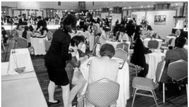
商談も活発に行われた