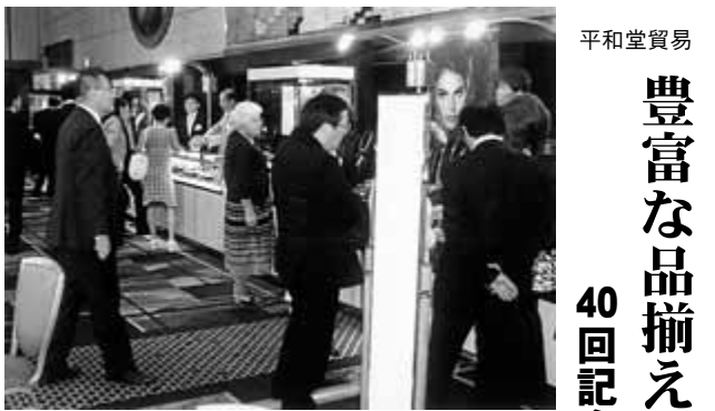
大勢のお客がつかめた