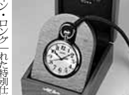
鉄道時計限定モデル