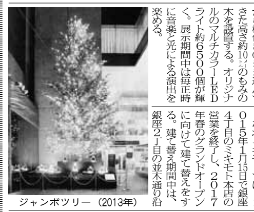
ジャンボツリー (2013年)