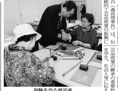
指輪を作る参加者

約8時間かかって過ぎてもスマホで連絡がつくため、時間を厳守しようという意識が薄れてきている。社会人が約8時間に遅れたら、罰金770万円を失う。