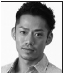
高橋 大輔(プロフィギュアスケーター)

表彰式(パーティー)の詳細・入場のお申込みは→ www.ijjt.jp/besdre/