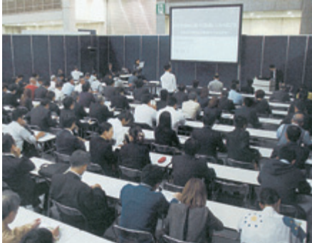
大好評だった新企画のI O F T レンズ技術セミナー