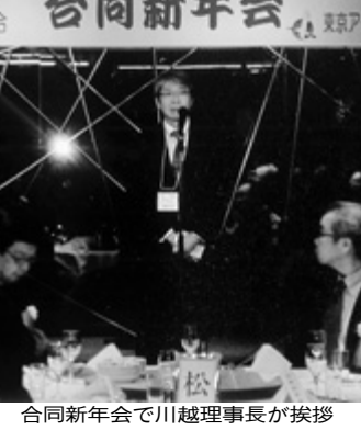
川越理事長が挨拶