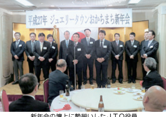
新年会の壇上に勢揃いしたJTO役員

ジュエリータウンおかしまち(JTO)は、新年会を1月27日午後6時半から東区・東上野のオールドクラブ・東上野のホールで開催。