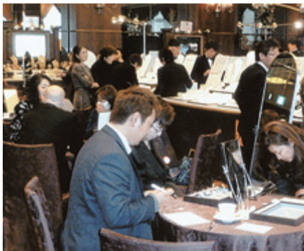
当日は多くの来場者でにぎわった

海外からの来場者は4065人に 第79回東京ギフトショー 株式会社 セレナ 〒110-0016 東京都台東区台東4-18-10 5F TEL 03(3834)3491 FAX 03(3835)4729