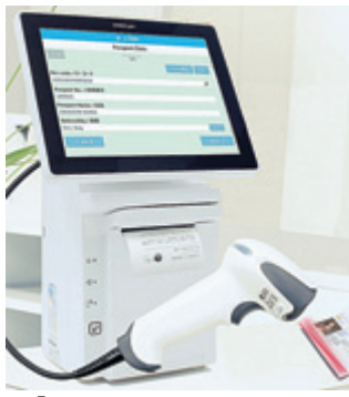
「あつと免税」レンタルセットハード機器

「宝飾100人会議」では、同会議に関心のある方を対象に、東京・御徒町「オーラムビルB1」で4月22日に説明会を開催する。 日本の宝飾業界の体質は、これまでいかに、品質と価値について消費者に正しい情報を伝えてきたのか、インターネットやTVショッピングなどで宝飾店の売り上げが奪われていく流れを座視