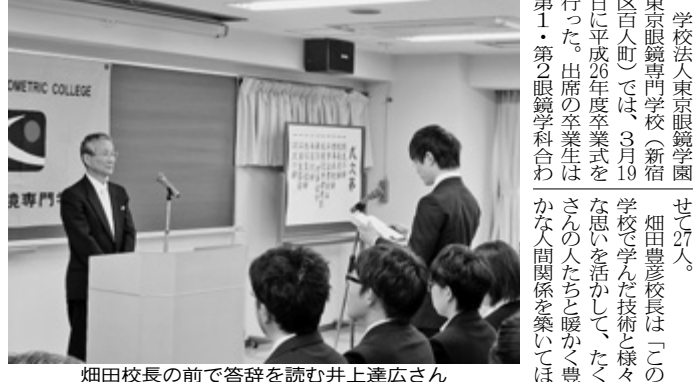
学校法人東京眼鏡学園 センター。 東京眼鏡専門学校(新宿区百人町)では、3月19日に平成26年度卒業式を挙げて、27人の卒業生を送り出した。出陣の卒業生は、学校の先生やご家族、ご友人と涙ぐみながら、卒業を祝った。