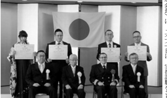
新オプトメトリストへの認定証授与式

日本オプトメトリック協会(愛知県名古屋市長一成一成会長)は、「オプトメトリスト」認定試験を3月4日に実施。その結果発表は、3月10日(土)に、愛知県名古屋市長一成一成会館で行われた。 認定証授与式には、認定証授与式は、3月20日(土)に、愛知県名古屋市長一成一成会館で行われた。 認定証授与式は、3月20日(土)に、愛知県名古屋市長一成一成会館で行われた。