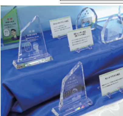
3パターンの加工法も展示

貴金属地金相場旬報 日付 金 Pt 銀 円相場 4月2日(木) 5,043円 4,903円 73.54円 119.52円 3日(金) 5,041円 4,887円 72.90円 119.63円 6日(月) 5,076円 4,953円 73.76円 118.98円 7日(火) 5,082円 4,951円 73.44円 119.82円 8日(水) 5,092円 4,977円 73.54円 119.85円 9日(木) 5,059円 4,946円 71.82円 120.27円 10日(金) 5,049円 4,948円 70.95円 120.50円 13日(月) 5,088円 4,989円 72.03円 120.63円 14日(火) 5,039円 4,894円 71.06円 119.86円 15日(水) 5,004円 4,883円 70.30円 119.49円 16日(木) 5,036円 4,918円 70.95円 119.29円 ・価格は店頭渡しグラム当り小売価格(消費税込み) ・外国為替相場値は米1ドル(午後5時現在の銀行間) 一田中貴金属工業(株)調べ