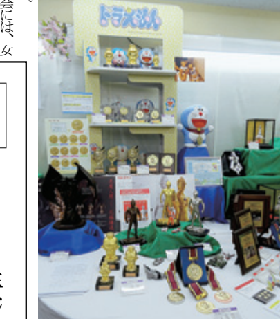
ドラえもんやウルトラマンのもの