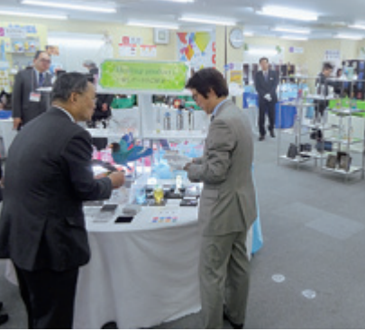
にぎわっていた会場