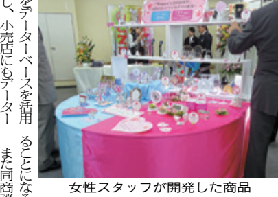
女性スタッフが開発した商品

のメダルを用意していたが、これに6種類追加して133種目になった。これは、業界でも一番多い。 さらに、「コティネート」で生み出す特注品として、タイレクトプリン、トドレーサー加工(2Dフラット加工)、サンドフラット加工の3パターンを用意している。これらに加工された素材に加工を施すことで、素材の個性を最大限に引き出す。また、小売店にもターゲットを絞って提供できるように、個性を開発された企画材に加工を施すことにより、見栄えも異なる商品が並べられた。