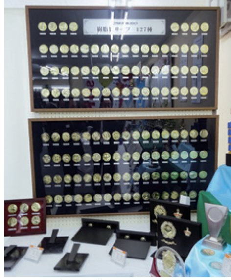
127種目に6種類を追加されたメダル

「その他食料品・飲料・酒・たばこ」の購入率が51.7%と高い。国籍・地域別では、「台湾」「韓国」「マレーシア」の時計や電気製品、「化粧品・香水」で中国の購入率が高い。 費目別の購入者単価(その費用を購入した人1人当たりの平均支出)は、「カメラ・ビデオカメラ」が6.6万円と最も高い。特に中国では8.9万円と、他の国籍に比べて高い。 買物場所は「スーパー・ショッピングセンター」(64.6%)、「空港の免税店」(55.7%)、「コンビニエンスストア」(52.8%)の順となっている。 今回の日本滞在中に消費税免税手続きを実施した人の割合は全体の20.6%だった。