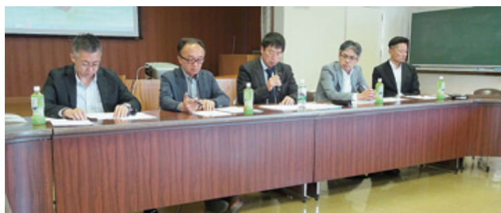
メーカー5社の懇談会代表者