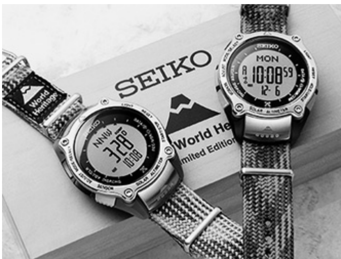
左が夏富士モデル(白)、右が赤富士モデル(黒)