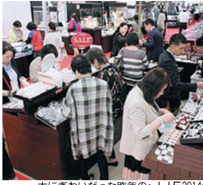
大にぎわいだった昨年のJJF2014会場