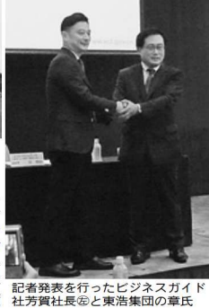
記者発表を行ったビジネスガイド社と東浩集團の専任役員