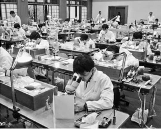
滋賀県で行われた時計技能競技全国大会の様子

10月22日から24日までの3日間、滋賀県大津市の近江勤業館で、全日本時計宝飾眼鏡小売協同組合(ジョウ・ジャパン)主催による「第28回時計技能競技全国大会」(後援：厚生労働省、滋賀県、中央職業能力開発協会、日本時計協会)が開催された。今回は12月に千葉県で技能五輪が開催されることもあり、例年よりも1カ月早い開催となった。