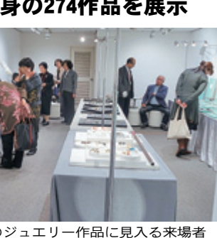
出展のジュエリー作品に見入る来場者

日本宝飾クラフト学院(東京都台東区)の生徒や講師が2年に一度開催される「第16回ピクシスの会創作ジュエリー展」が、11月11日から15日まで東京・銀座の大黒屋ギャラリーで開催された。同展には、今回のテーマである「童話」にちなむ23点の作品が展示された。