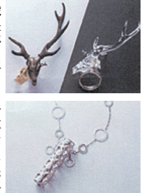
「死と再生」リング デザイン：角田いづみ 制作：山崎新造 制作：山崎新造 制作：山崎新造

山梨ジュエリーミュージアムが開催 2月27日から6月13日まで 山梨ジュエリーミュージアムが、2月27日から6月13日まで、山梨県山梨市にある山梨ジュエリーミュージアムで「アイデアをかたちにする職人展」を開催する。この展覧会は、山梨ジュエリーミュージアムの技術を受け継いだ職人たちが、その仕事を紹介する。山梨ジュエリーミュージアムの技術を受け継いだ職人たちが、その仕事を紹介する。山梨ジュエリーミュージアムの技術を受け継いだ職人たちが、その仕事を紹介する。