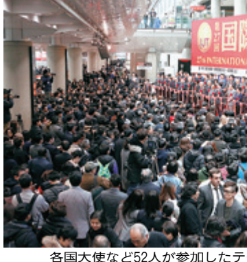
各国大使など52人が参加したテープカット

開会式では各国大使や海外業界団体の代表者、国内外の超有名人、52人が参加したテープカットが行われ、初日から1万人を超える来場者で賑わった。