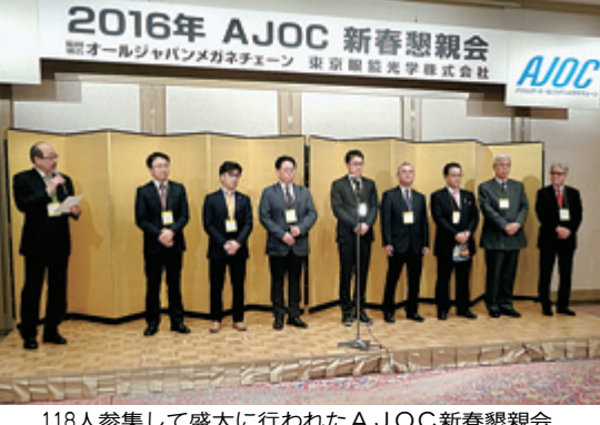
118人参加して盛大に行われたAJOC新春懇親会

「ヒ・カ・リ」ビデオ上映会 日本アイバンク協会が製作した「ヒ・カ・リ」ビデオが、1月19日に東京都・銀座の橋ビルにて上映された。