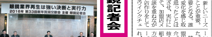
眼鏡記者会の熱いディスカッション

眼鏡記者会 初春から熱い議論 眼鏡記者会(加盟7社)は、1月20日、浅草ビューホテルで新春合同例会を開催した。