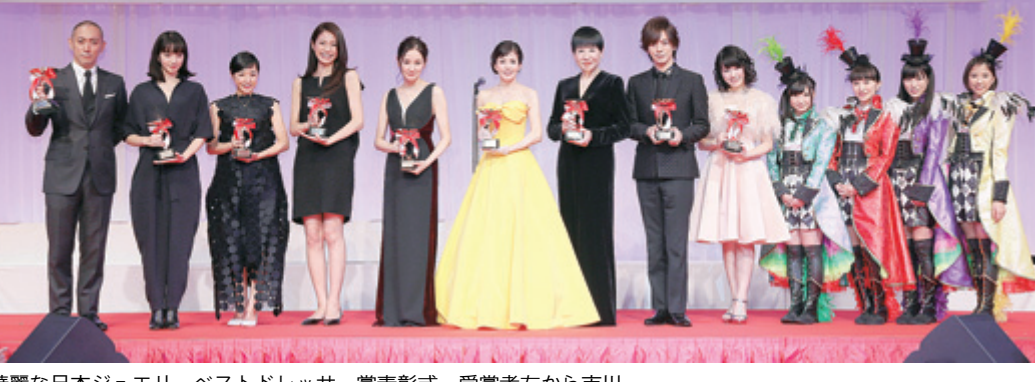
華やかな日本ジュエリーベストドレッサー賞表彰式。受賞者左から市川海老蔵、小林菜奈、井上真央、松下奈緒、吉田羊、沢口靖子、和田アキ子、DAIGO、佐々木彩夏とももいるクローバーZ (敬称略)

日本最大級の宝飾展「シヤンパシヨ・日本ジュエリー」が、1月20日から、昨年比1.1倍の来場者を集めた。