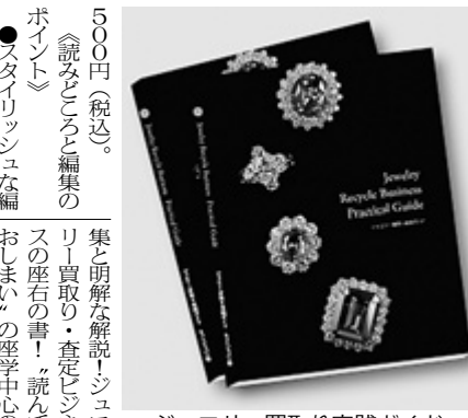
ジュエリー買取り実践ガイド

ジュエリー買取り実践ガイド(1) 2016年5月1日出版。価格5400円(税込)。本書は、ジュエリー買取りの実践的なノウハウを解説し、読者の理解を深めることを目的としている。著者は、ジュエリー業界の専門家であり、豊富な経験に基づいて、読者に役立つ情報を提供している。