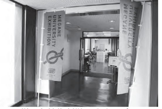
様々な技術が学べるオープンファクトリー型展示会