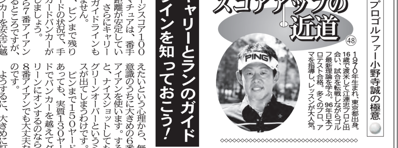
PGAツアー選手小野寺誠のポートレート