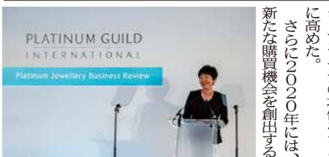
新たな需要の創出の施策を語るPGI・シユリックCEO