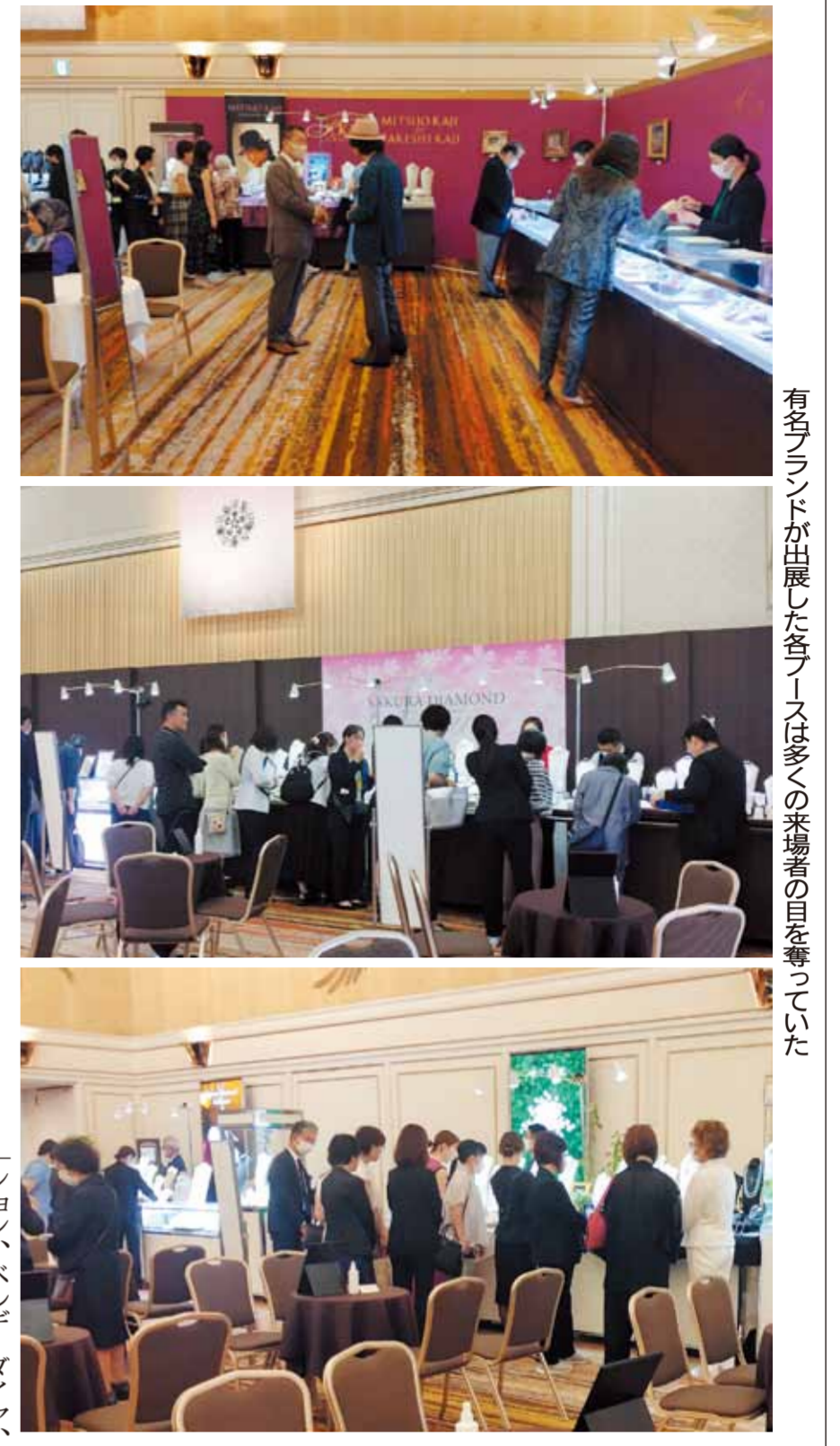
有名ブランドが出展した各ブースは多くの来場者の目を奪っていた

8月28日から30日まで東京ビッグサイトで 製品展示 イベントステージ セミナー