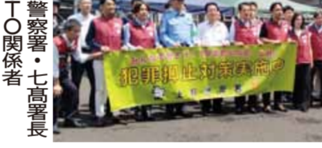
上野警察署七高署長とJTO関係者