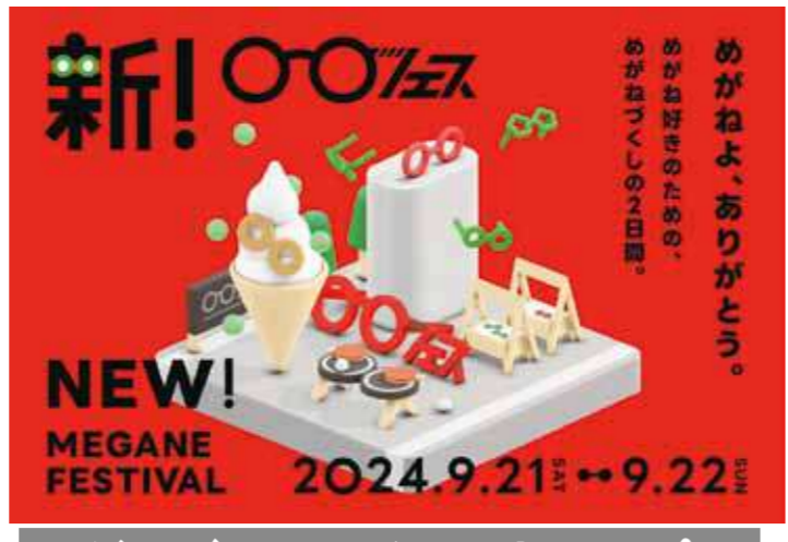
めがねづくりのイベントいっぱい

めがねに感謝とお別れを「めがね供養」 个性的めがね Meet Meet Megane! 目が点!になるめがね作り「メガ展」