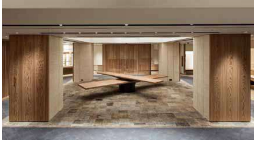
プロジェクトムービー「時と生きる！」も公開予定

プロジェクト「時と生きる！」も公開予定 和光本店地階フロア改装オープン プロジェクト「THE GIFT OF TIME」を7月18日(木)から開始した。 プロジェクト「THE GIFT OF TIME」を7月20日にリニューアルオープンした。