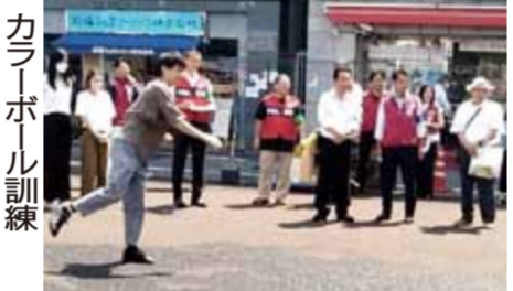
カラーボール訓練