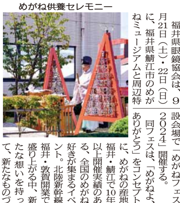
めがね供養セレモニー