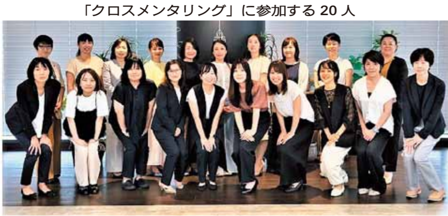
「クロスメンタリング」に参加する20人