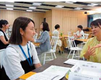
メンターとメンティーの顔合わせ

のキックオフより、3回のメンタリング、中間共有会を経て、1月のクロージングまで、約7か月のプログラムを実施。 ■実施目的 ・女性のキャリア開発支援 ・上司ではない他者からのアドバイス、対話から自分を見つめる(業務の支援) 自律と長期的なキャリア開発(精神的支援) ■メンター、メンティーの視野の拡大 ・各社における次世代リーダーの育成及び女性管理職比率の向上 ■実施概要 ・参加予定者 ・メンター(部長クラス以上の女性)、メンティー(課長クラスの女性、各社2名(5社計20名))