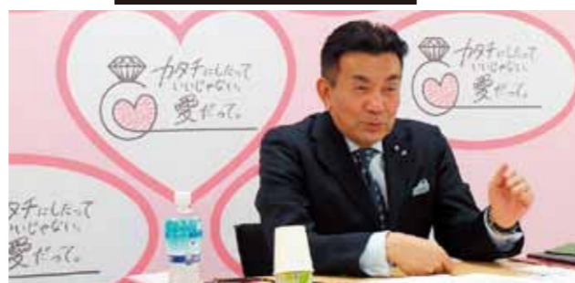
ジュエリー業界の発展を熱く語る長堀会長